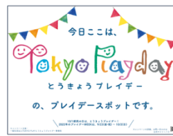
例1) 「スポットです」ポスター