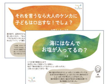
例3) 企画ポスター「よむよむプレイデー」「こどもの声」