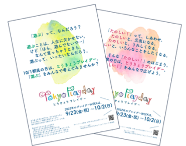
例2) キャンペーンポスター